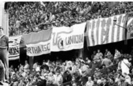
AM 27. JANUAR 1990 KÖNNEN HERTHA- UND UNION-FANS ENDLICH GEMEINSAM FEIERN.

In den 1980er Jahren verbindet Ost-Berliner Union-Anhänger und West-Berliner Herthaner eine besondere Freundschaft: Bis zu hundert Hertha-Fans fahren regelmäßig zu Union-Spielen in die Köpenicker Wuhlheide. Die Staatssicherheit überwacht und infiltriert die Szene – ohne Erfolg.