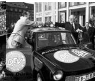
BESIEGELUNG DER FUSSBALL-EINHEIT IN LEIPZIG, 1990