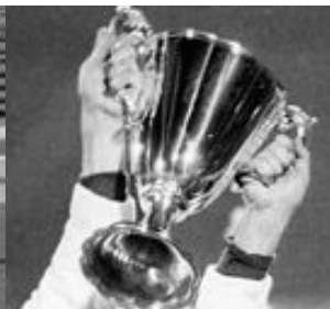
SIEGER IM EUROPAPOKAL DER POKAL-SIEGER VON 1974: 1. FC MAGDEBURG

Die Bundesrepublik gehört zu den erfolgreichsten Fußball-Nationen der Welt. Sie erringt zwischen 1954 und 1990 drei Weltmeistertitel, drei weitere WM-Finalteilnahmen sowie zwei Siege bei Europameisterschaften. Außerdem können mehrere Bundesligamannschaften europäische Pokalwettbewerbe für sich entscheiden. Die Bilanz des DDR-Fußballs fällt wesentlich bescheidener aus: 1974 gelingt es dem 1. FC Magdeburg den Europapokal der Pokalsieger zu gewinnen. Bei den Olympischen Spielen in Montreal 1976 holen die DDR-Fußballer die Goldmedaille.