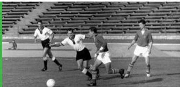
DAS ERSTE VON ZWEI »GEISTERSPIELEN« FINDET IM SEPTEMBER 1959 IM OST-BERLINER WALTER-ULBRICHT-STADION STATT.

Die Ausstellung will die einigende Kraft des Fußballs anschaulich machen – jenseits aller Grenzen und Ideologien.